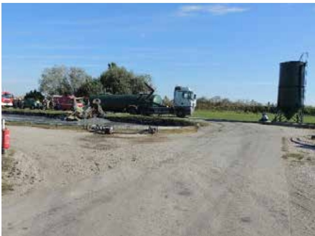
13. kép. a baleset helyszíne

Példa: A sérült munkavállaló egy Weimar típusú rakodógépet behúzással akart elindítani, úgy, hogy a rakodógépet sodronykötéllal tehergépkocsihoz kötötte. A tehergépjármű vezetője elkezdte húzni a rakodógépet, majd az iszaptároló medencénél a kanyarban megállt a tehergépkocsival. A rakodógép nem állt meg, irányítatlanul egyenesen a medencébe haladt. Az iszap teljesen ellepte a kezelőfülkét a munkavállalóval együtt, akit élve nem tudtak kimenteni. A munkavállaló a tevékenységre nem kapott utasítást, holott munkavédelmi oktatásban részesült, de ez a tevékenység az oktatás tárgyát nem képezte.