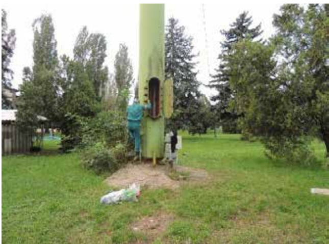
9. kép. glóbusz bejárata

A munkavállaló balesete orvosi vélemény szerint életveszélyesnek minősült, de a kórházi kezelést követően felgyógyult.