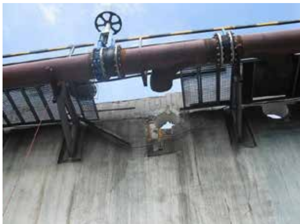
3. kép.