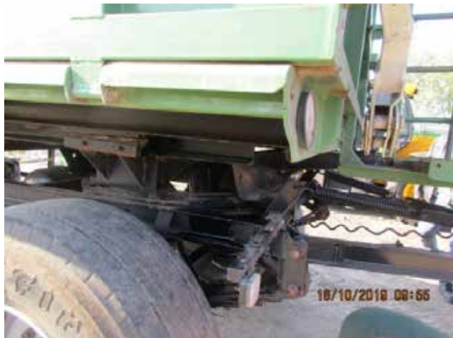
11. kép. billenőplatós pótkocsi, melynek platója az alvázhoz szorította a munkavállalót (munkavédelmi hatóság felvétele)

A billentő pozícióban lévő platót a szerelés, javítás során visszacsapódás ellen a munkavállaló alátámasztással nem rögzítette. A munkavállalónak a karbantartási tevékenység nem volt feladata, erre a tevékenységre oktatásban nem részesült.