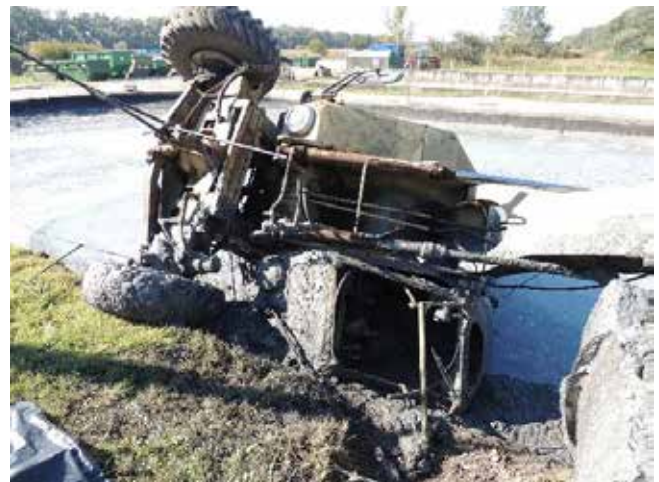
14. kép. az iszaptároló medencébe borult gép (munkavédelmi hatóság felvétele)