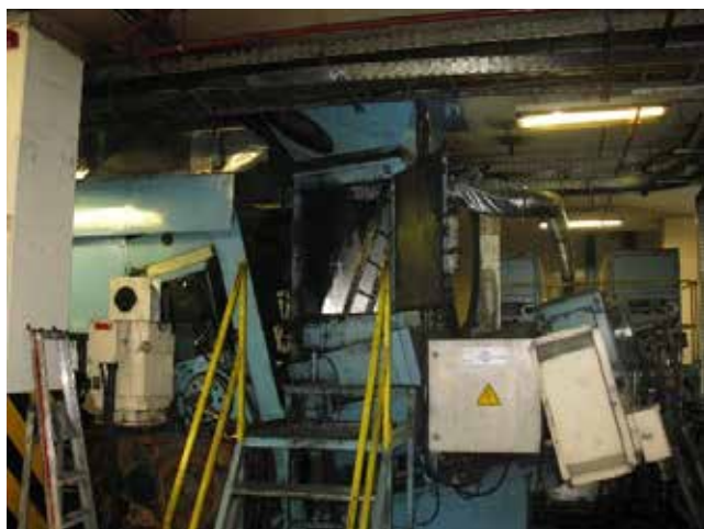
12. kép.

Példa: Beszállási engedély hiányában a munkavállaló a több szintes gumiipari gép földszinti részén a gépbe hibaelhárítás céljából bemászott. Az első emeleten tartózkodó személy nem tudott róla, gépet elindította és a gépben tartózkodó munkavállalót a forgó-mozgó részek összeréselték, helyszínen elhalálozott.