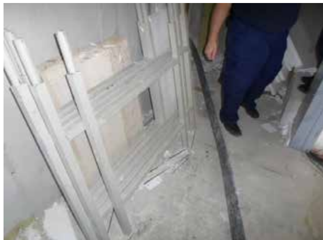
2. kép. betont szállító tömlő, mely a korlátelemet az aknába lökte (munkavédelmi hatóság felvétele)