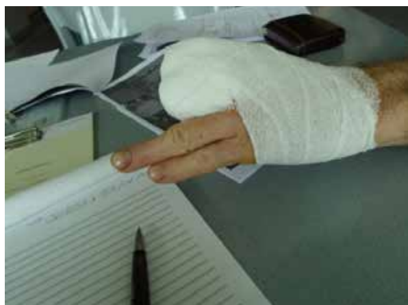
4.-6. kép.