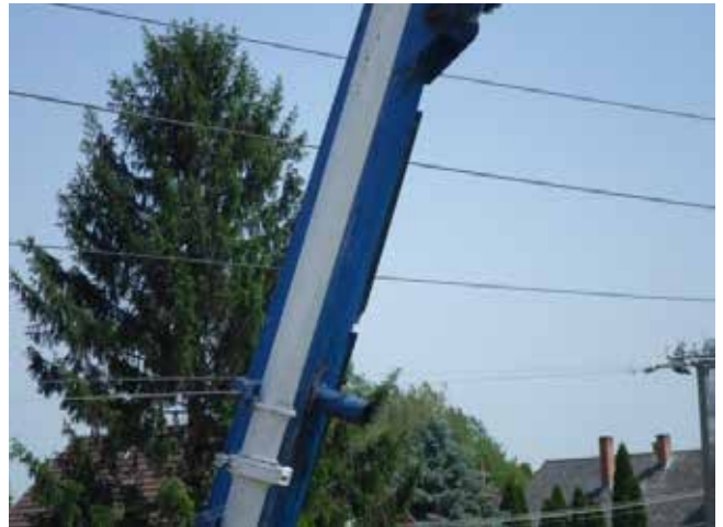
7.-8. kép. betonpumpa gémje a villamos felsővezeték közvetlen közelében