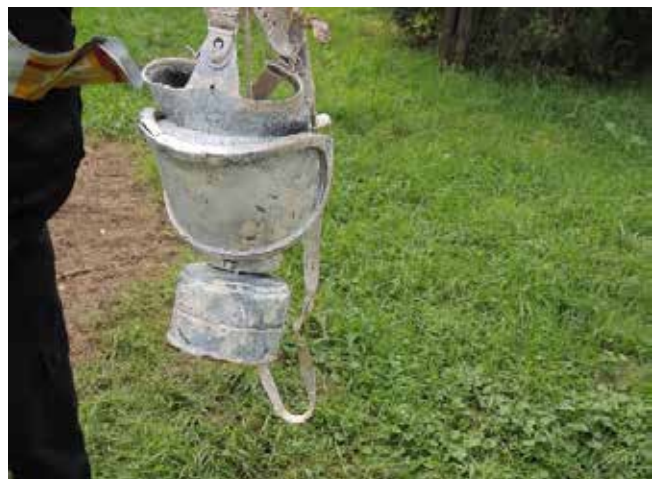
10. kép. nem megfelelő légzésvédő (munkavédelmi hatóság felvétele)