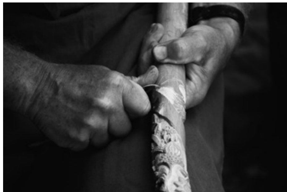
Hübler Nóra - Népi motívum