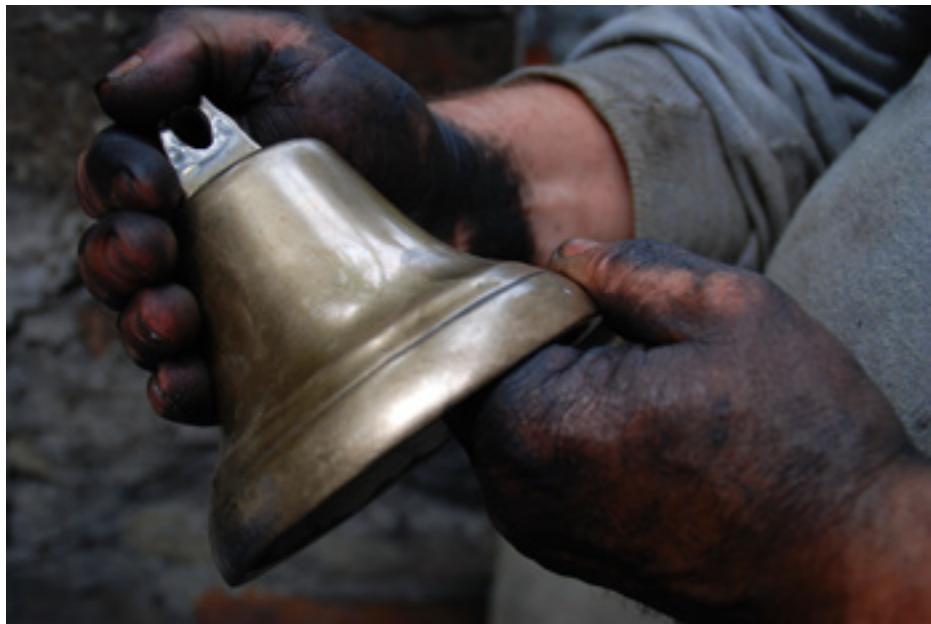
Szilágyi Éva - Remekművem