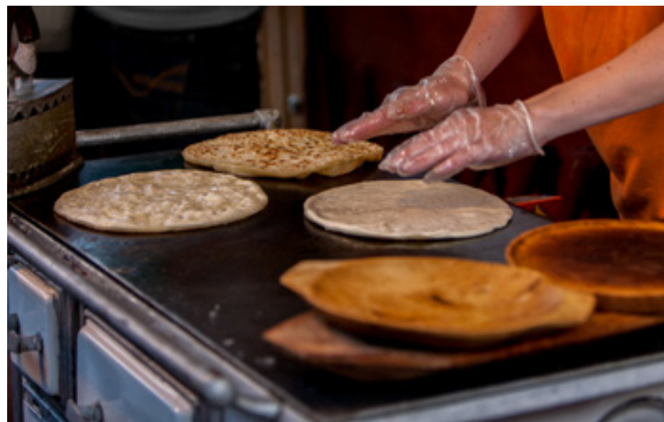
Fehér Vilmos - Vigyázó kezek