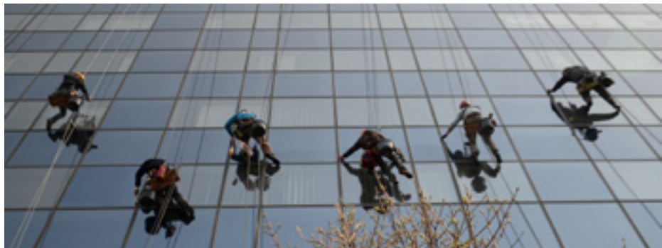
Koncz Dezső - Ablaktisztítók