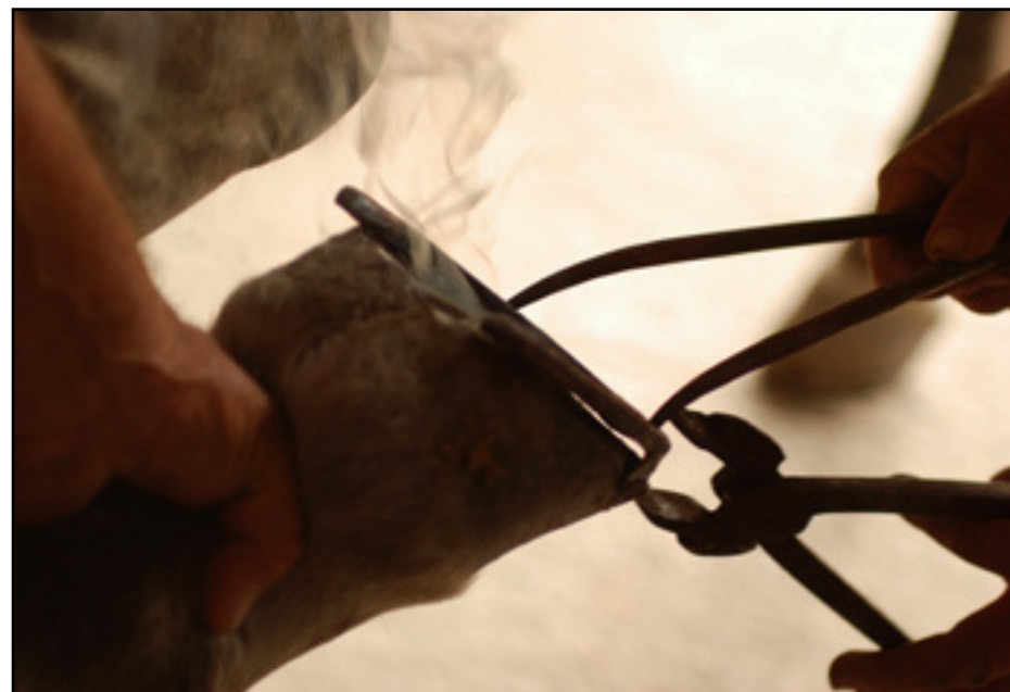
Szilágyi Éva - Méretre szabva