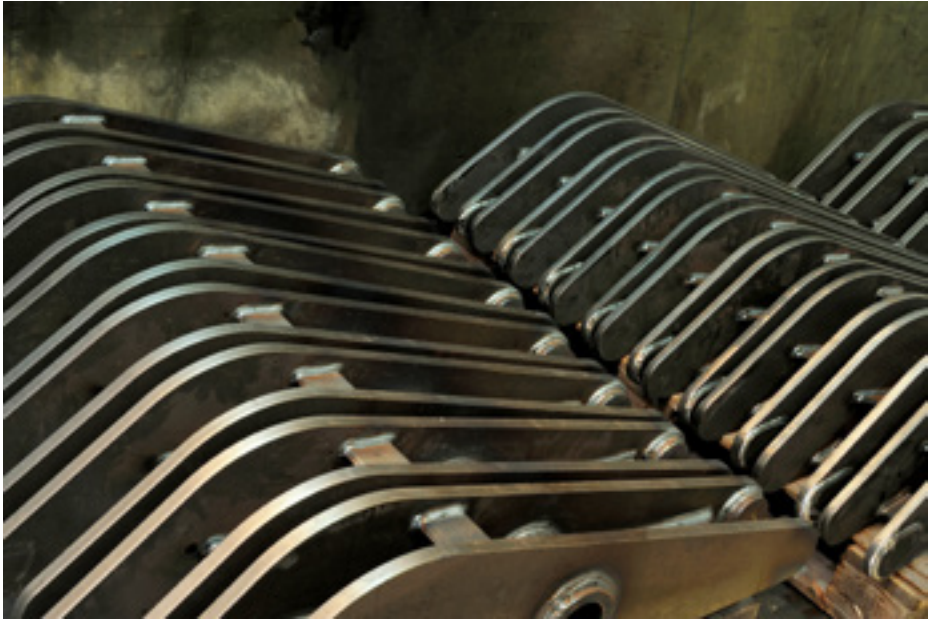
Somogyi Márk - Klónok