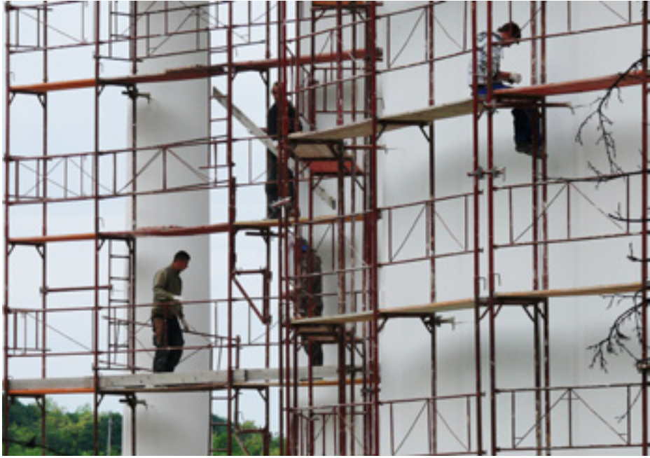
Hatvani Ágnes - Hálózat