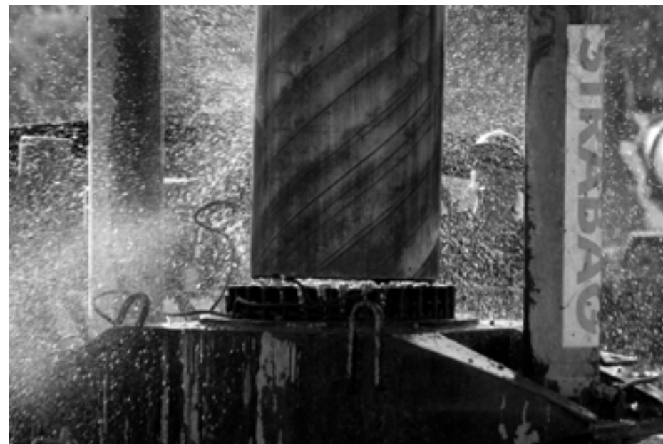
Dobóczy Zsolt - Tisztítás