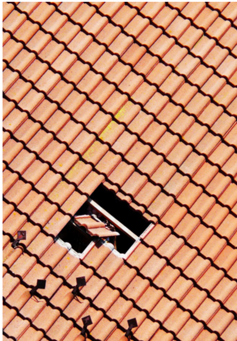
Hatvani Ágnes - Utolsó mozdulatok - III. helyezett