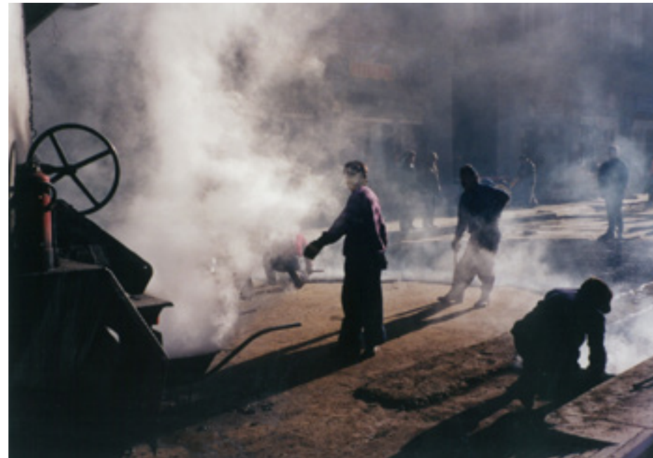
Nerhaft Antalné - Aszfaltozók