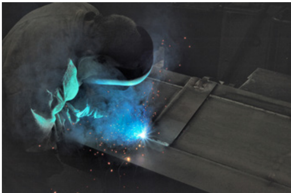
Somogyi Márk - Szerszáma Kék Fény