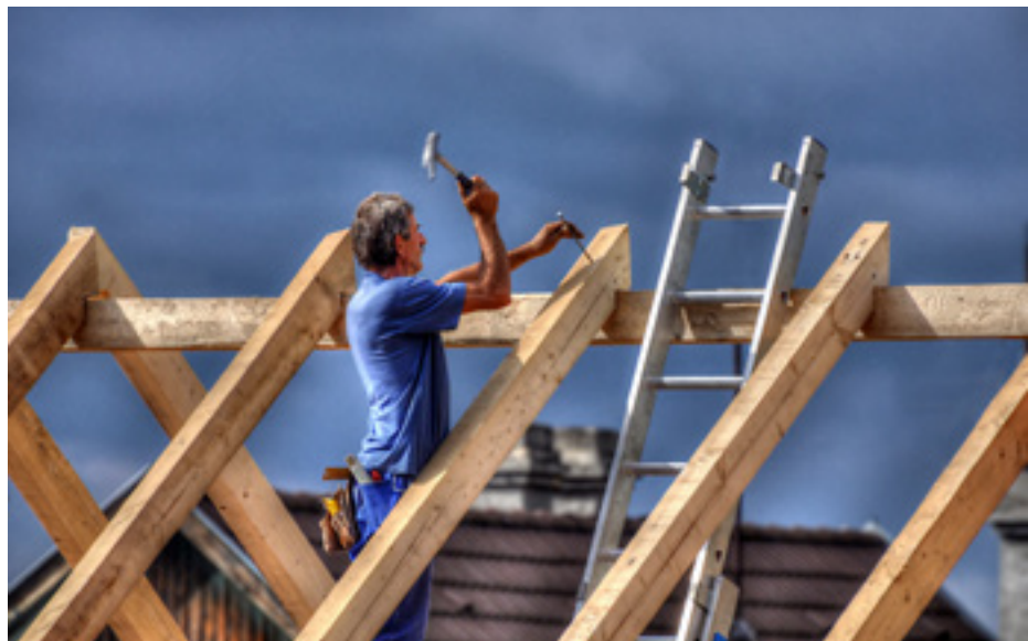
Ligeti László - Magasban - Különdíj