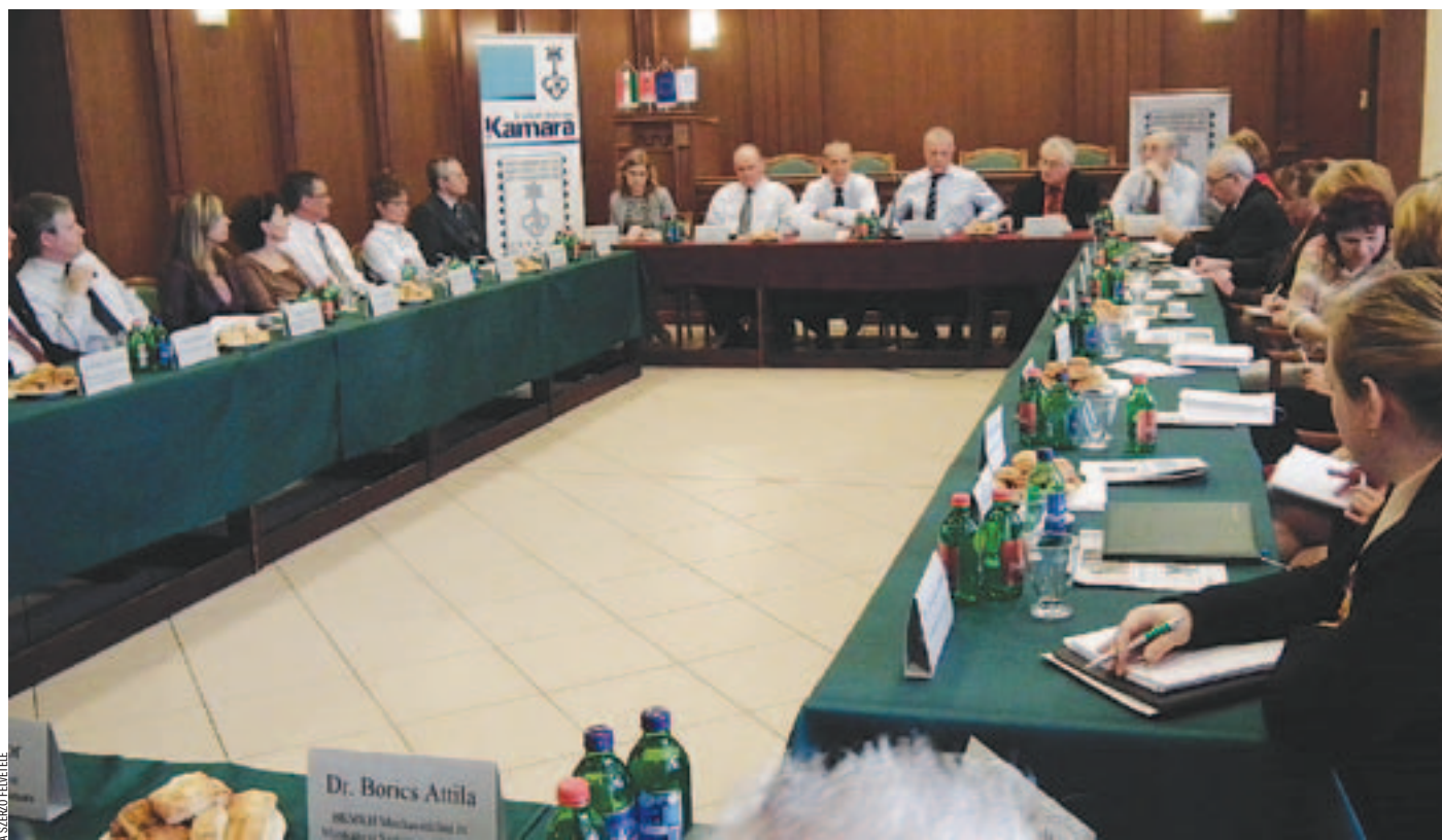
A kamara székházában harmadik alkalommal rendeztek hatósági kerekasztal-tanácskozást

NAV Az Ügyintézői Contact Center sokat segít az adózóknak