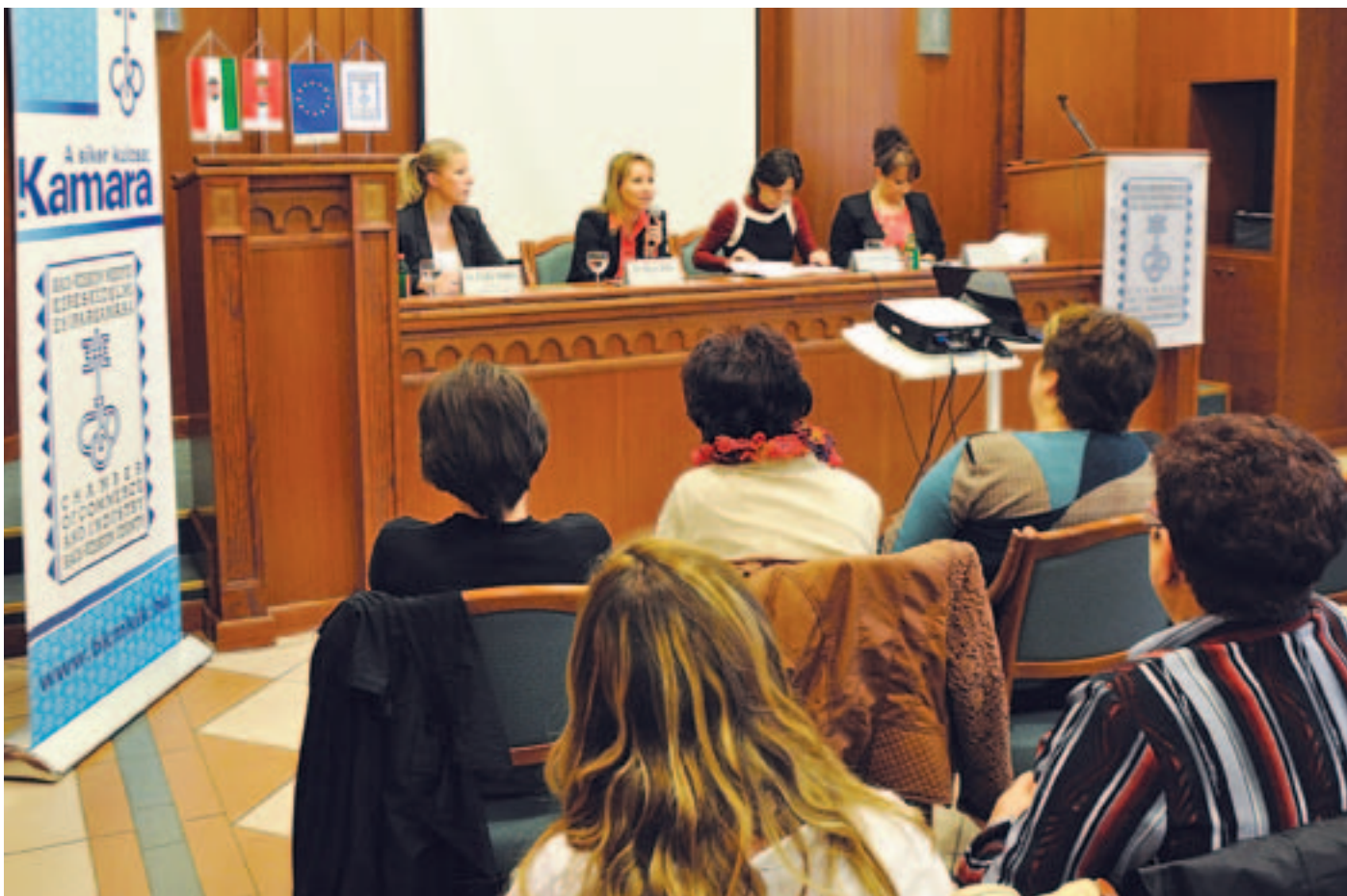
Nagy érdeklődés mellett tartottak ismertetőt a Ptk. változásairól a kamarában

KECSKEMÉT A szakembereket nagy érdeklődéssel hallgatták