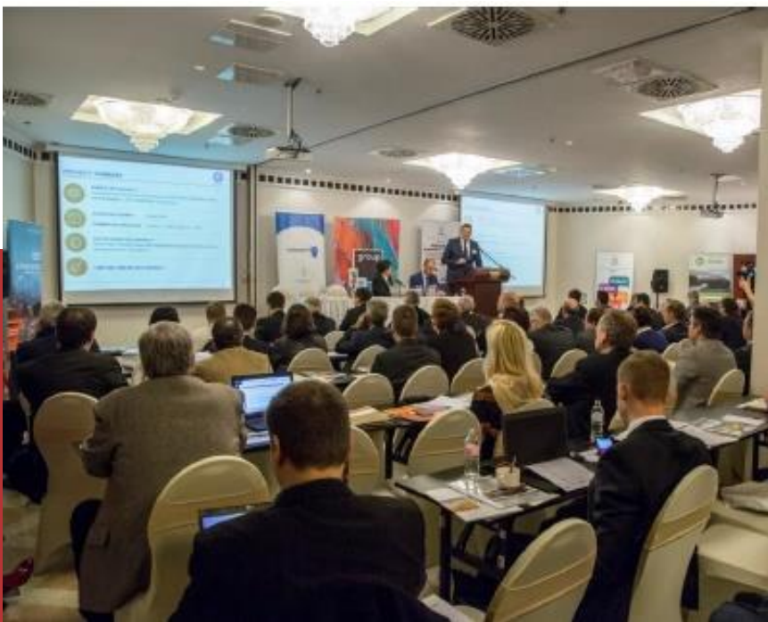
ELŐADÁS ÉS SZÓRÓANYAG AZ ASZTALOKON